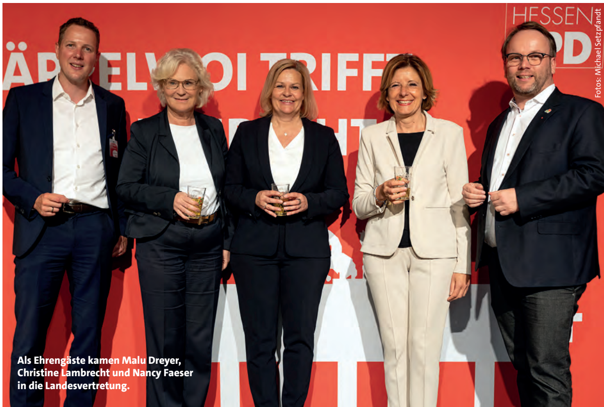
Als Ehrengäste kamen Malu Dreyer, Christine Lambrecht und Nancy Faeser in die Landesvertretung.