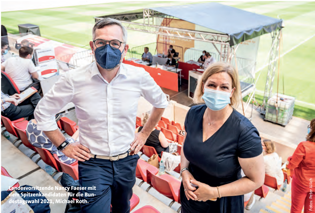
Landesvorsitzende Nancy Faeser mit dem Spitzenkandidaten für die Bundestagswahl 2021, Michael Roth.