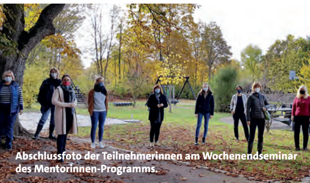
Abschlussfoto der Teilnehmerinnen am Wochenendseminar des Mentorinnen-Programms.

Aufgrund der erfolgreichen Arbeit der vergangenen Jahre startete die hessische SPD 2020/2021 ein neues Frauen-Mentoring-Programm zur Stärkung der Vernetzung und Förderung von Frauen. Der Fokus lag besonders auf der Unterstützung aktiver und interessierter Frauen im Vorfeld des Kommunalwahlkampfes. Insgesamt nahmen elf interessierte und motivierte Frauen am Mentoring-Programm des Landesverbandes teil, die von erfahrenen Politikerinnen der kommunalen oder der Landesebene gefördert und beraten wurden. Im Jahr 2020 fand ein erstes gemeinsames Treffen zum Austausch und Brunch im Sommer statt sowie ein gemeinsames Seminarwochenende im Oktober. Im Jahr 2021 fand ein weiteres Präsenztreffen statt. Die eingeschränkte Möglichkeit der Präsenztermine wurde ergänzt durch verschiedene digitale Angebote, sei es zum lockeren Austausch oder in Seminarform.